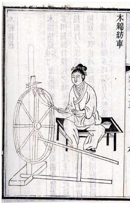
上图为《木棉纺车图》，出自元代王祯所著的《农书》，同为三锭脚踏纺车。